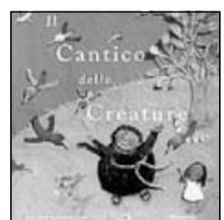
La copertina del "Cantico delle Creature"

AUDE LE MORZADEC Cile EDT Giralangolo, euro 9,00